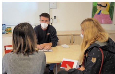
In einem Vorgespräch können Fragen zur Impfung geklärt werden.