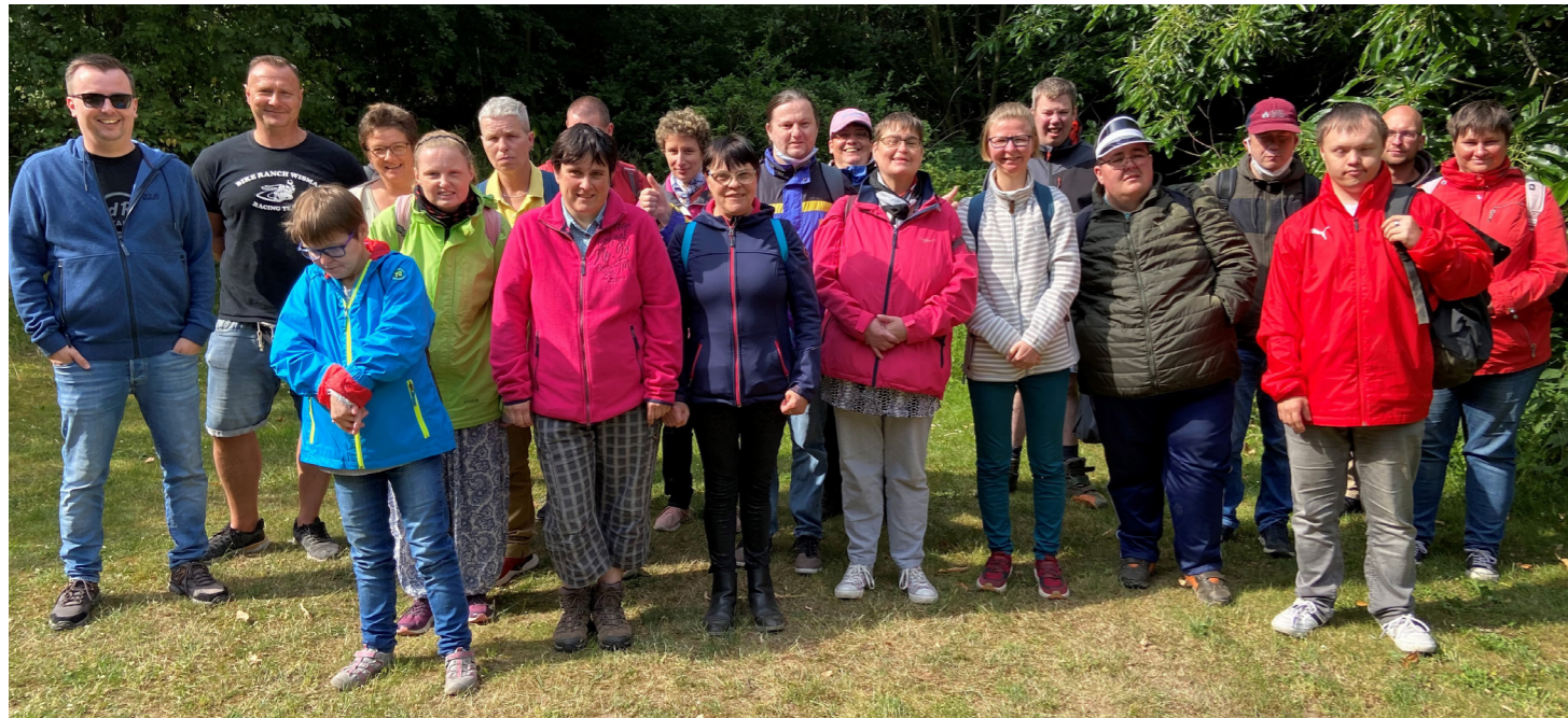
Ob über 5 oder 10 Kilometer: Alle haben Lust, wieder einen gemeinsamen Wandertag zu erleben.

Am Sonntag, dem 19.06.2022, fand nach langer Zeit wieder ein Wandertag statt. Der Wanderverein Mölln hatte eingeladen. Auf der Hinfahrt nach Mölln regnete es leicht. Doch als wir ankamen, brach die Wolkendecke langsam auf. Sogar die Sonne kam heraus.