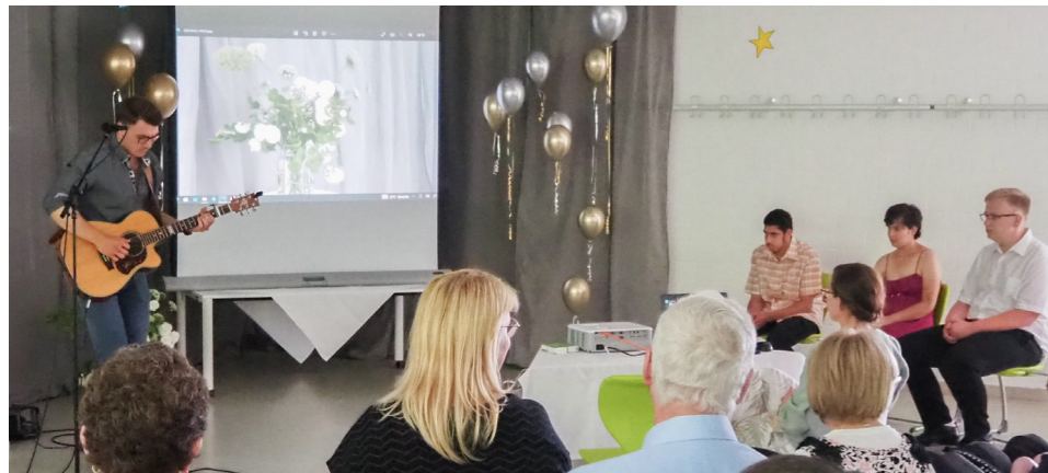
Sänger ÖXL untermalt den letzten Schultag mit stimmungsvollen Liedern.

Am letzten Tag eines Schuljahres gibt es Zeugnisse. Für drei junge Menschen aus der Berufsbildungsstufe war der 01.07.2022 zugleich der letzte Schultag. Feierlich wurden sie von ihren bisherigen Lehrer*innen, Erzieher*innen und Mitschüler*innen verabschiedet. Der Wismarer Sänger ÖXL sorgte mit seinem Live-Auftritt für die passende Stimmung.