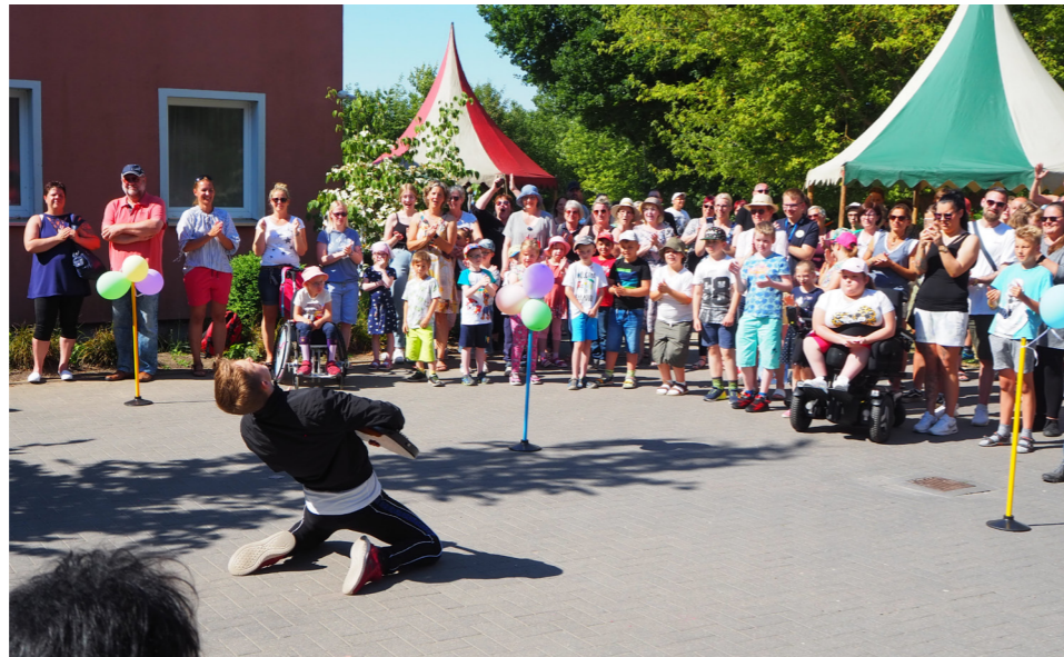
Das Sommerfest sorgte auch musikalisch für viel Abwechslung.

Es ist eine schöne Tradition, das Ende eines Schuljahres mit einem Fest zu begehen. Am 24.06.2022 fand nach drei Jahren endlich wieder ein Sommerfest statt. Schüler*innen mit ihren Eltern, Partner*innen sowie Unterstützende der Schule freuten sich über den Handwerksmarkt des „Bauspielplatzes Schwerin“. Dank einer Spende des Lions Club Wismar sorgten diese Angebote für ein buntes und fröhliches Treiben bei herrlichem Sonnenschein.